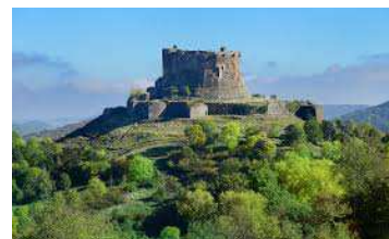
Château de Murot (63)

Voyager au temps des chevaliers, des croisades, et des joutes équestres et des ripailles.